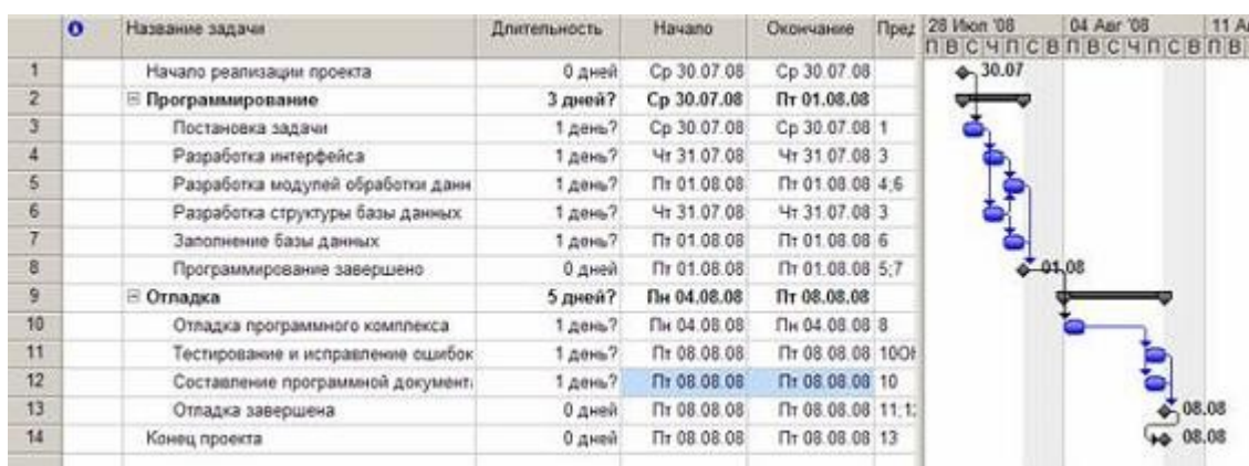
Рис. Результат преобразований